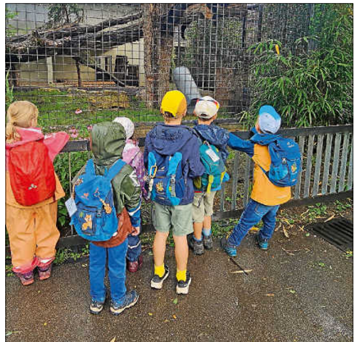
Interessiertes beobachten von Jaguarmännchen Theo