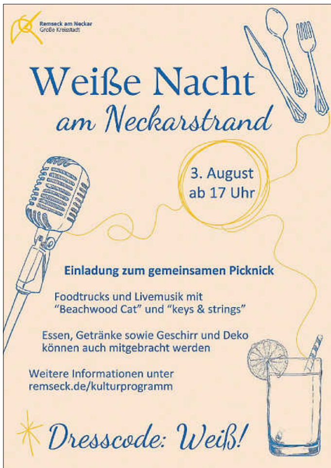
Plakat: Stadtverwaltung Remseck am Neckar

Bitte beachten Sie, dass die Veranstaltung nur eingeschränkt barrierefrei ist.