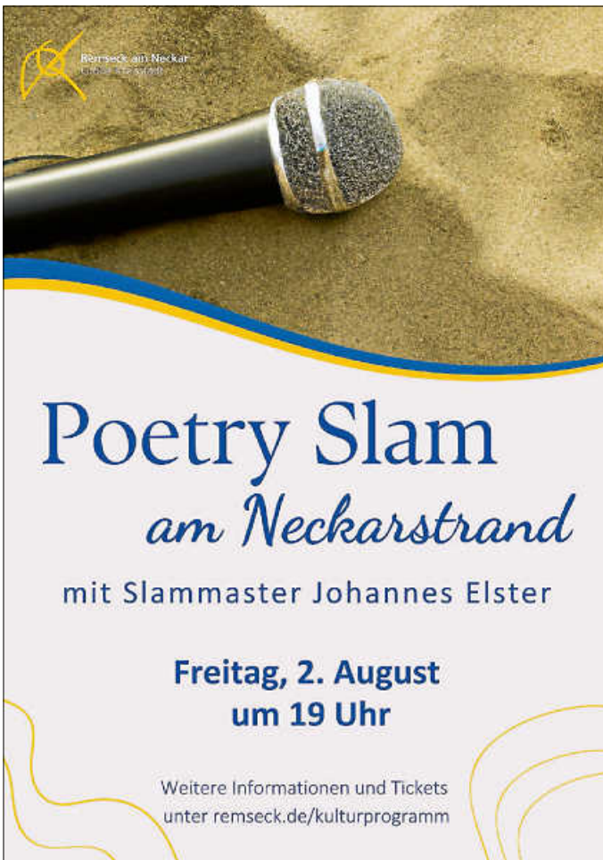
Plakat: Stadtverwaltung Remseck am Neckar

Freitag, 02.08.2024 - 19 Uhr Remsecker Neckarstrand Tickets: 15 Euro (ermäßigt 13 Euro)