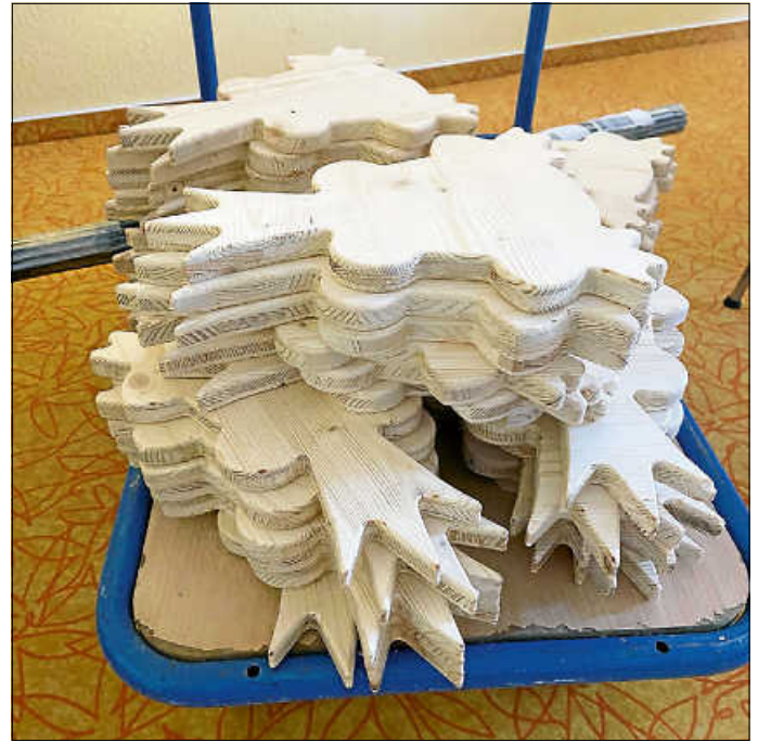
Viele Frösche warten auf ihr buntes Gewand

Wir freuen uns auf kreative Ideen und tolle Gartendeko !