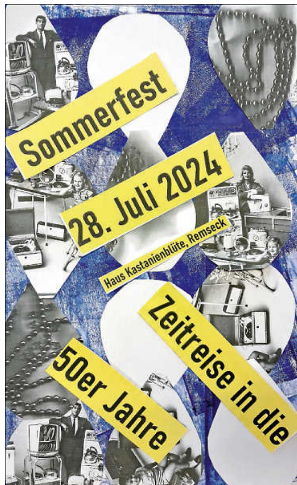
Plakate zum Sommerfest

Am 28. Juli von 11:00 bis 17:00 Uhr findet im Haus Kastanienblüte das Sommerfest statt. Wie an allen Festen wird es wieder ein Mot-to geben, und die Wahl ist diesmal auf die 50er-Jahre gefallen. Für Unterhaltung sorgt wieder DJ Maurice aus Remseck und Gäste aus der Umgebung sind natürlich immer willkommen!