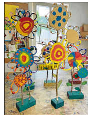
Blumen aus der Mittwochs- gruppe

Der Werkraum ist 'ne tolle Sache, mach doch mit!