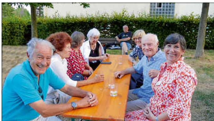
lauter gutgelaunte Gäste

Wie bereits angekündigt findet am 02. Juli das Sommerfest statt. Wir freuen uns schon jetzt auf einen gemütlichen Abend mit euch, für gutes Essen und Unterhaltung ist natürlich gesorgt.