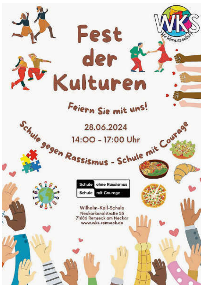
Plakat: S. Goetzbilgen

Das Fest der Kulturen wird neben Musik- und Theateraufführungen, Ausstellungen und Präsentationen auch kulinarische Spezialitäten aus unterschiedlichen Kulturen und Ländern anbieten.