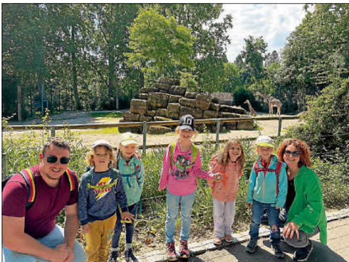
Die Vorschüler vor den Giraffen