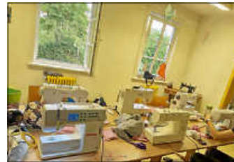
Kreativ-kommunikatives Nähen