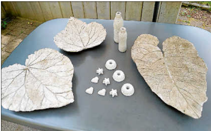
Beispiele aus unserem letzten Kurs

Anmeldungen bitte unter hobbybude-hochdorf@gmx.de . Wir freuen uns auf euch!