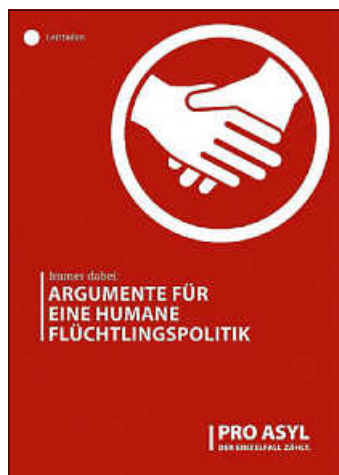
Grafik: PRO ASYL