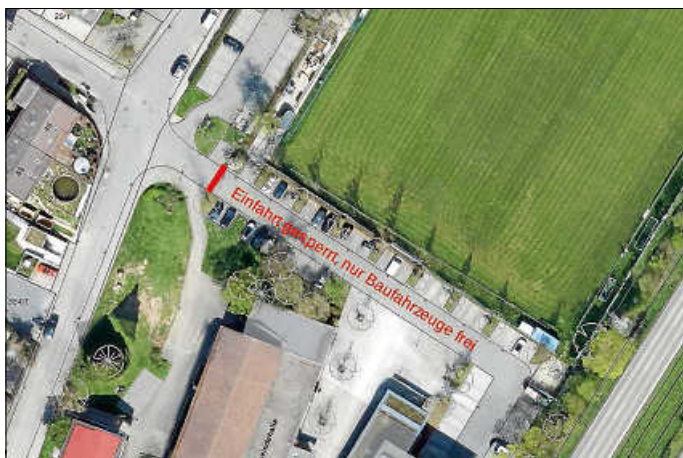
Baustellenzufahrt Bildungscampus Aldingen

Wegen Bauarbeiten am Bildungscampus Aldingen bleibt die Zufahrt zur Sporthalle Aldingen mit den angrenzenden Parkplätzen in der Kornwestheimer Straße ab dem 21.05.2024 gesperrt. Die Zufahrt ist dann nur noch für Baustellenfahrzeuge freigegeben. Bitte nutzen Sie auch die Parkplätze beim Haus der Bürger.