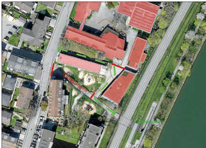
Lageplan Fußwegumleitung Mühle

Im Zuge der Baumaßnahmen am Bildungscampus Aldingen muss wegen Tiefbauarbeiten in der Zeit vom 13.05. bis 22.05.2024 der Fußweg von der Neckarkanalstraße zur U-Bahnhaltestelle Mühle kurzzeitig verlegt werden. Ein Umweg über das angrenzende Schulgelände wird ausgeschildert. Bitte beachten Sie die geänderte Wegführung.