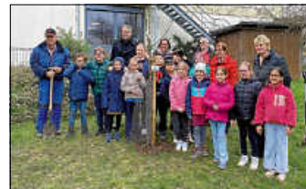
Freude über den gepflanzten Baum

Der erste Schritt zur Reaktivierung des Schulgartens ist getan. In einer gemeinsamen Aktion von Schülern der dritten Klasse, dem Förderverein der Grundschule Hochberg, dem OGV Hochberg und Lehrern der Grundschule Hochberg wurde der Schulgarten der Grundschule Hochberg um einen Apfelbaum bereichert. Die Pflanzung des Baumes war ein besonderes Ereignis für die beteiligten Schüler, die mit großer Begeisterung dabei waren. Sie lernten, wie man einen Baum richtig pflanzt und welche Pflege er benötigt, um gut zu gedeihen. Der Obst- und Gartenbauverein Hochberg gab wertvolle Tipps und erklärte den Kindern, wie wichtig die Pflege und Wasserversorgung in den nächsten Monaten ist, damit das junge Bäumchen Wurzeln schlägt und richtig anwächst.