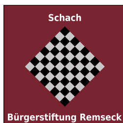
Logo: Gerald Winkler

Seine Schachkarriere begann er mit fünf Jahren. Zuhause hat er zufällig ein Schachbrett mit Figuren gefunden