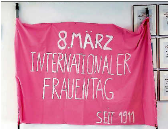
Eingangsbereich Haus Kastanienblüte

Unsere Männer haben außerdem rote Nelken an alle Damen verteilt. Was für eine schöne Geste!