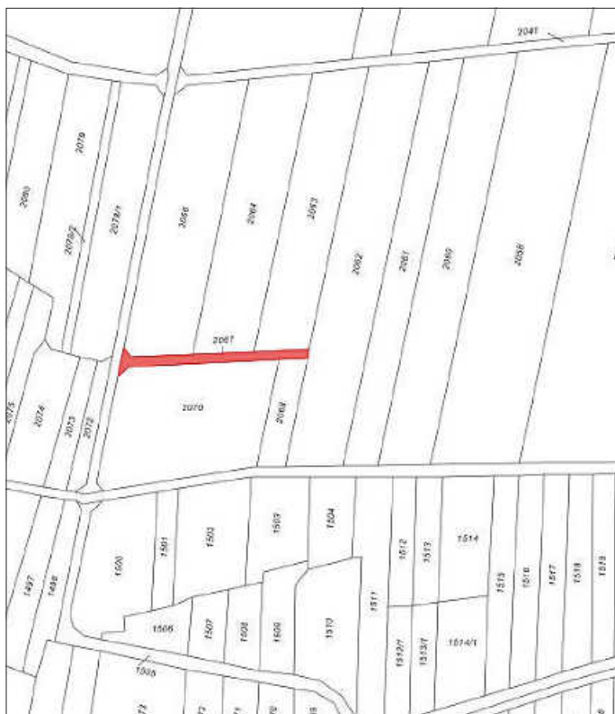
Flst. Nr. 2067, Bei den Mussen