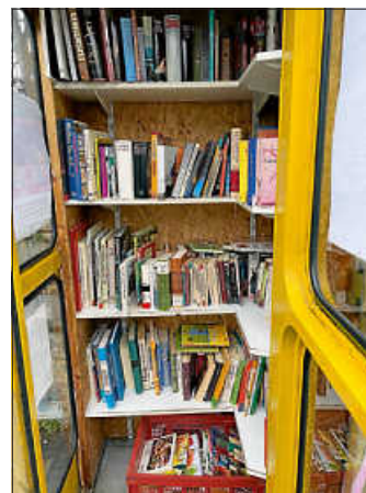
Bücherschrank Hochberg - So bitte Nicht!

Liebe Nutzerinnen und Nutzer der Remsecker Bücherschränke, wir freuen uns sehr, dass die Bücherschränke so gut angenommen werden. Sicher hat schon mancher darin den ein oder anderen (Lese)schatz entdeckt. Leider kommt es zurzeit sehr häufig vor, dass unsere Mitarbeiterinnen und Bücherschränkepatinnen, die die Schränke liebevoll betreuen, unschöne Entdeckungen machen und sehr viel entsorgen müssen.