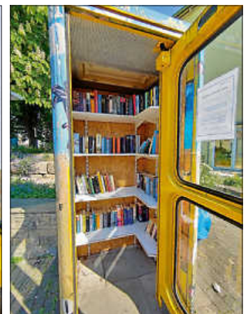
Bücherschrank Hochberg - So bitte hinterlassen!