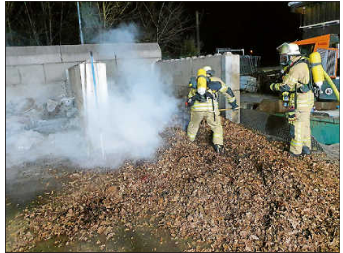
Brand 1 - Städtischer Bauhof

Aus noch ungeklärter Ursache kam es am Mittwoch, 1.3.2023 gegen 20:15 Uhr zu einer Rauchentwicklung im städtischen Bauhof. Ein Laubhaufen in einer Betonbox hat zu rauchen begonnen. Nebenbei, im Haus der Feuerwehr, hielten sich Feuerwehrkameraden auf, welche sofort eingreifen konnten und damit eine Brandausbreitung verhinderten. Mit einem städtischen Fahrzeug wurde der Haufen auseinandergezogen und mit Wasser abgelöscht. (is)