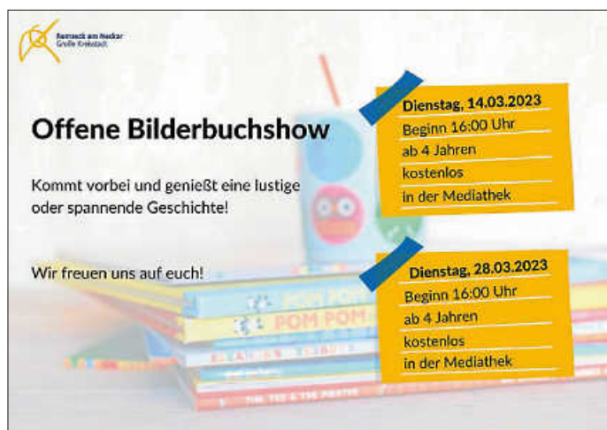
Plakat: Mediathek im KUBUS