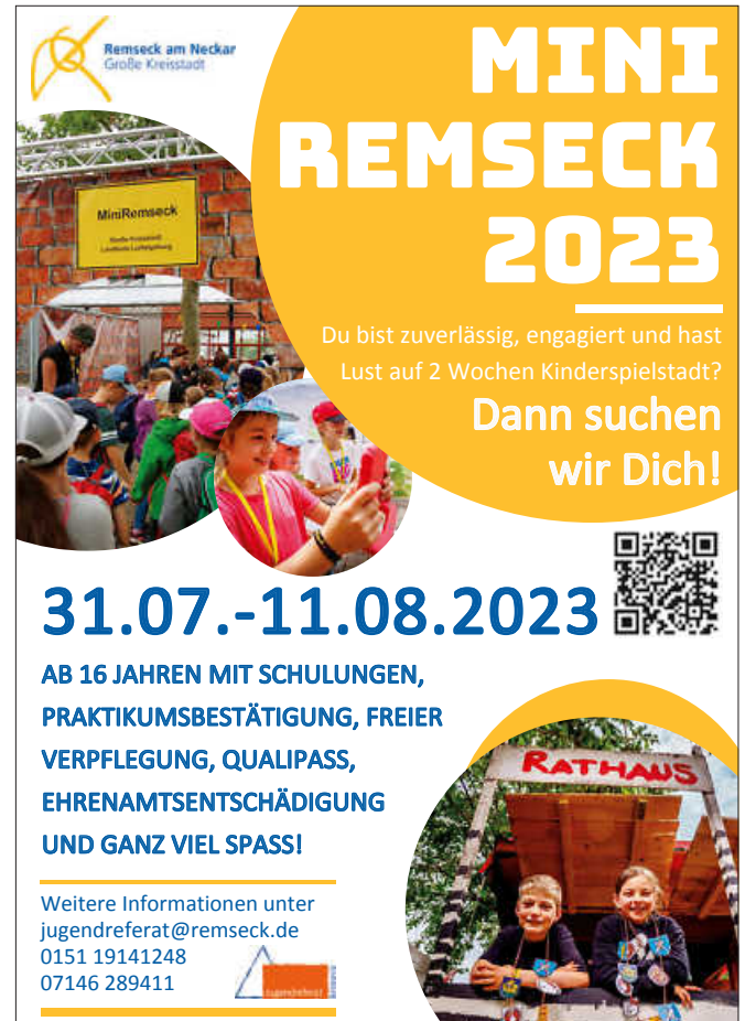
Plakat: Jugendreferat Remseck

Wir suchen zudem noch ehrenamtliche Helferinnen und Helfer ab 16 Jahren. Wir bieten spannende Schulungen, einen Qualipass und Praktikumsbestätigungen sowie freie Verpflegung, eine Ehrenamtsentschädigung und jede Menge Spaß!