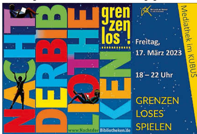
Plakat: Mediathek im KUBUS

Die Mediathek hat an diesem Termin, nicht zu den gewohnten Öffnungszeiten von 15 - 18 Uhr, sondern von 18 - 22 Uhr geöffnet. Am darauffolgenden Samstag, 18.03.2023, bleibt die Mediathek geschlossen. Die Ortsbücherei Hochdorf bleibt am Freitag, 17.03.2023, ebenfalls nachmittags geschlossen.