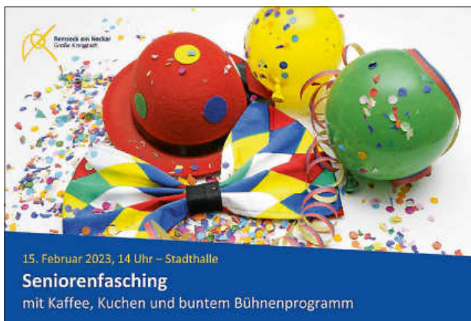
Plakat: Stadt Remseck am Neckar

Sollten Sie Unterstützung bei der Anreise benötigen, melden Sie sich bitte beim Haus der Bürger (Tel. 07146 280-249). Es besteht für Personen mit eingeschränkter Mobilität (Rollator etc.) die Möglichkeit, einen Fahrdienst in Anspruch zu nehmen.