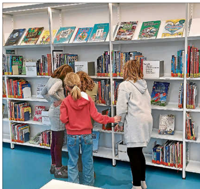
Bilder Workshop d. Mediathek