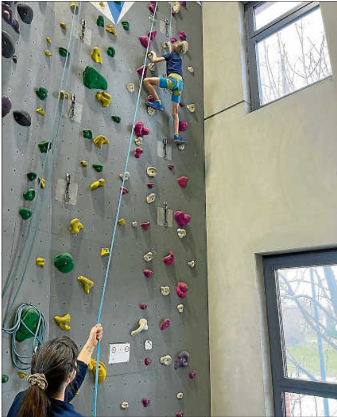
Hoch hinaus beim Klettern

Im Griffwerk in Ludwigsburg wurde geklettert bis die Seile spannten und die Finger schmerzten. Nach einer kurzen Einweisung durch die Profis dort ging es los. Die Sicherung beim Klettern übernahmen die Mitarbeiter, beim Bouldern durfte man sich ungesichert an den Wänden entlang bewegen und den farblich markierten Routen folgen. Manch einer war erstaunt, wie schwierig und anstrengend das ist, obwohl es so einfach wirkt.