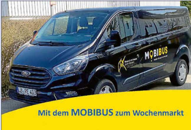
Plakat: Stadt Remseck

Der MOBIBUS ermöglicht Remsecker Senioren, Familien und Bürgerinnen und Bürgern mit kognitiven und/oder körperlichen Einschränkungen mehr Mobilität im Stadtgebiet.