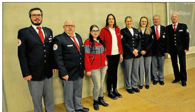
Der neu gewählte Vorstand und die neu gewählte Bereitschaftsleitung des DRK Ortsverein Remseck am Neckar