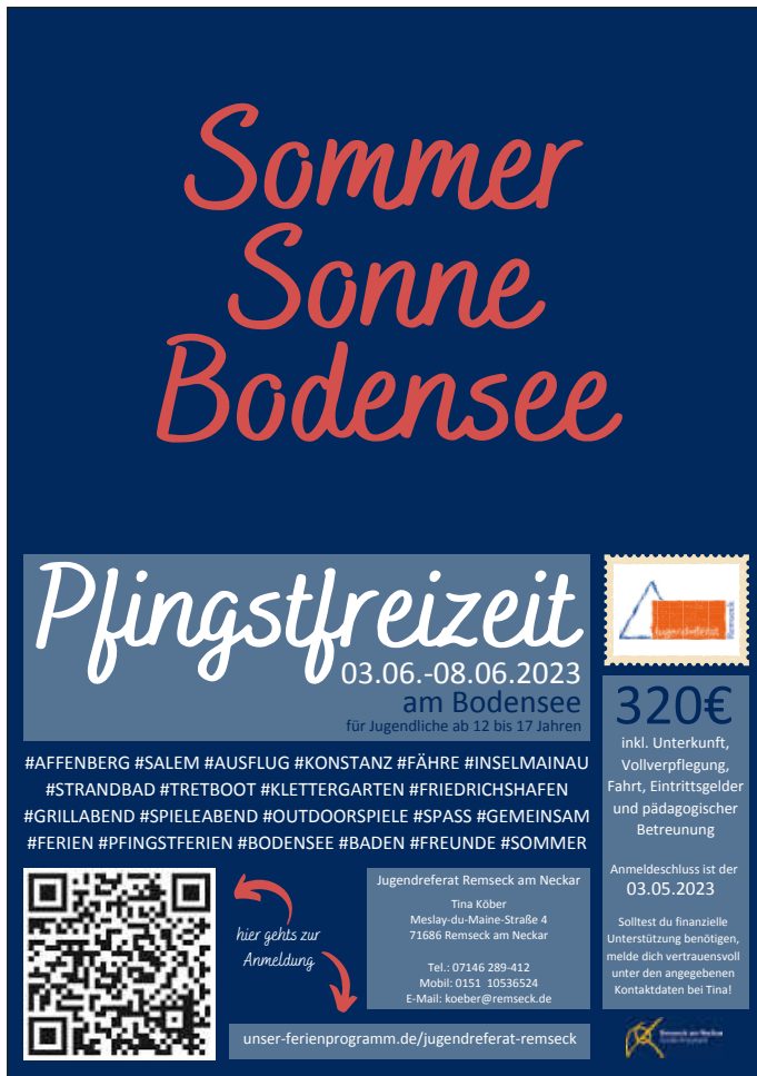
Plakat: Jugendreferat Remseck