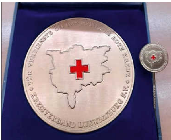
Rot-Kreuz-Medaille in Gold

In der vergangenen Woche wurde unserem 1. Vorsitzenden Klaus Wünsch die Rot-Kreuz-Medaille in Gold des DRK Kreisverbandes Ludwigsburg verliehen, es handelt sich hierbei um die höchste Auszeichnung, die innerhalb des DRK Kreisverbandes verliehen werden kann. Bedanken möchten wir uns damit bei Klaus Wünsch für seine jahrzehntelange Arbeit für den DRK-Ortsverein Neckargröningen und das außerordentliche Engagement im Zeichen der Menschlichkeit.