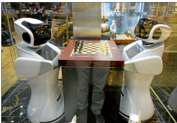
Ist dies die Zukunft des Schachspiels?