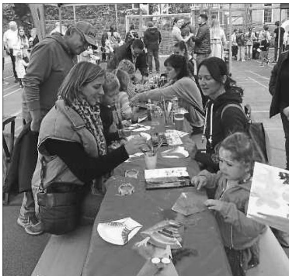
High Village Kinderbasteln

Endlich konnten wir wieder mitfeiern bei High Village - dem Fest zum Weltkindertag! Unter dem Motto: „Kinderrechte“ gab es ein tolles Bühnenprogramm und viele Spielstände der Jugendhilfe,