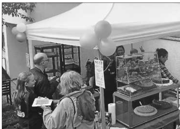
High Village Kuchen bei der Hobbybude

Für die richtig gute und unkomplizierte Zusammenarbeit und die Organisation dieses tollen Festes möchten wir uns bei der Jugendhilfe Hochdorf herzlich bedanken und unser größter Dank gilt natürlich den vielen Kuchenspenderinnen und -spendern sowie allen fleißigen Helfern! Ihr seid Klasse!