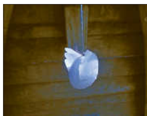
Das fliegende Ei