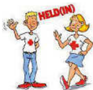
Grafik: JRK Remseck