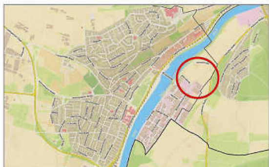
Stadt Remseck am Neckar