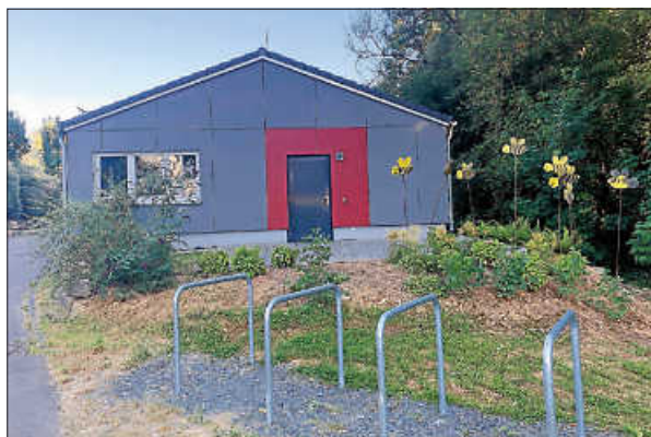
Fahrradständer an der Hobbybude Hochdorf

Schon seit einigen Wochen freuen wir uns über die neuen Fahrradständer, die von der Stadt angrenzend an die Hobbybude aufgestellt wurden. Man kann dort nicht nur das Fahrrad abstellen, sondern dieses auch sicher an den Bügeln abschließen (wenn man ein Schloss dabei hat). Auf diesem Wege sagen wir vielen Dank an die Stadt Remseck und freuen uns über viele Fahrradfahrer bei den Kursen in der Hobbybude!