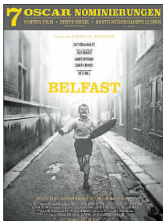
Plakat: Focus Features

und Sitzgelegenheiten mit. Denken Sie an entsprechende Kleidung und Decken.