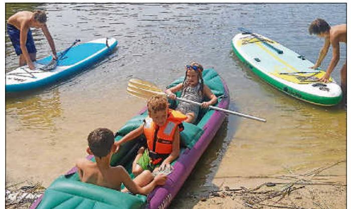
Ab auf den See...