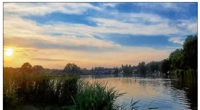
Schön war 's!