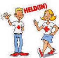
Grafik: JRK Remseck