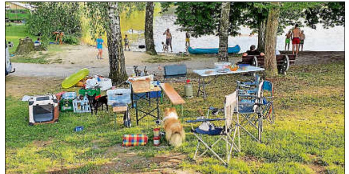
Zelten am Hammerschmiedesee

Bei schönsten Wetter trafen sich drei zelterfahrene Familien am Hammerschmiedesee für ein wunderschönes Wochenende. Morgens gings mit Brötchen und Rührei von glücklichen Zwerghühnern los, wir befuhren den natürlichen See mit Standup Paddel (und Hund an Bord) und Schlauchkanadier oder plantschten an Sandstrand. Die ganzen zwei Tage verbrachten wir direkt am See und hatten ein tolles Wochenende zusammen!