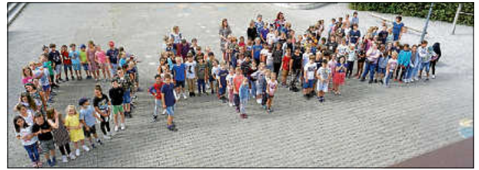
Danke-Aufstellung der Schülerinnen und Schüler

Das Projekt Zirkuswoche wird nach zwei anstrengenden, entbehrungsreichen Jahren mit Distanz- und Wechselunterricht einen großen Beitrag für den Gemeinschaftssinn, Gemeinschaftsleistungen und sozialen Kontakt an der Schule leisten. Das soziale Miteinander zwischen den Schülern wird lange Zeit von diesem Vorhaben profitieren und leistet nachhaltig einen Beitrag für das Zusammenleben an der Schule. Und vor allem bleibt es den Schülern jahrelang in Erinnerung! Wir freuen uns bereits darauf.