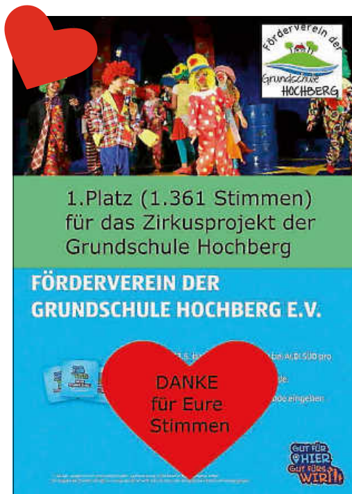
Dankeplakat Spendenkampagne Plakat: Förderverein

Wir haben dafür bei den Eltern der Grundschüler sowie bei Mitgliedern und Freunden des Fördervereins um Unterstützung gebeten aber auch Hochberger Bürgerinnen und Bürger angesprochen. Wir waren überwältigt, wie groß die Unterstützung von Beginn an war.