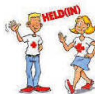
Grafik: JRK Remseck