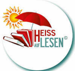
Logo: HEISS AUF LESEN

Seit dem 11.07.2022 und noch bis zum 17.09.2022 läuft unsere Sommerleseaktion HEISS AUF LESEN für Lesebegeisterte der 1. bis 7. Klasse. Man kann weiterhin in der Mediathek im KUBUS vorbei kommen und sich dafür anmelden! Zur Anmeldung muss ein Erziehungsberechtigter dabei sein. Es gibt tolle Preise zu gewinnen! Auch für Erwachsene gibt es im gleichen Zeitraum eine Sommerleseaktion: Blind Date mit einem Buch . Und auch hier kann man, mit etwas Glück, etwas gewinnen.