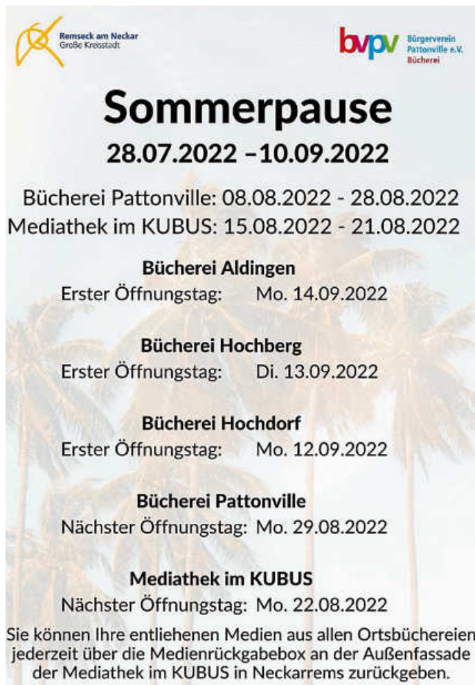
Plakat: Mediathek im KUBUS