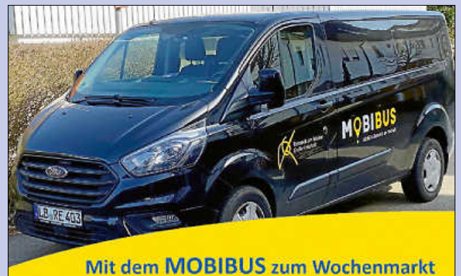
Mit dem MOBIBUS zum Wochenmarkt

Der MOBIBUS ermöglicht Remsecker Senioren, Familien und Bürgerinnen und Bürgern mit kognitiven und/oder körperlichen Einschränkungen mehr Mobilität im Stadtgebiet.