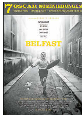
Plakat: Focus Features