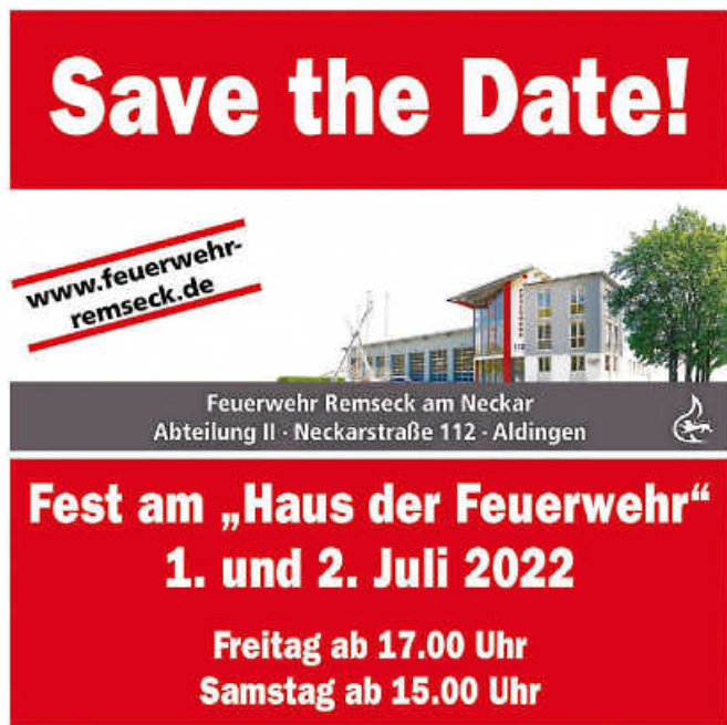
Plakat: Feuerwehr Remseck