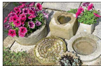
Betongießen Projektbeispiele

Am Fr. 08. Juli 2020 ab 19 Uhr gehts in der Hobbybude kreativ zu, denn wir wollen mit Euch Erwachsenen wieder DIY-Projekte mit Beton umsetzen. Dabei kommen verschiedene Formen zum Einsatz. Ob Trittstein, Vogeltränke, Dekoschale, Zackentopf oder eigene Ideen, jede(r) kann machen was er/sie möchte! Trittsteine können gleich mit Kieselsteinen oder Mosaiksteinchen verziert werden. Wegen der Planung treffen wir uns nach Absprache vorher, um zu klären, welche Formen gebraucht werden.