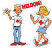
Grafik: JRK Remseck

das Jugendrotkreuz wird neu aufgebaut. Wir suchen motivierte und interessierte Heldinnen und Helden, die Lebensretter werden möchten. Wir treffen uns alle zwei Wochen donnerstags, um die Grundlagen der Ersten Hilfe und andere tolle Aktionen durchzuführen, wie Ausflüge, Film- und Spieleabende.