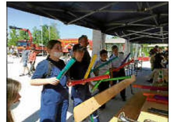
Musikalische Umrahmung des Spaß am Infostand

An unserem Infostand hatten Groß und Klein die Möglichkeit unsere Instrumente genauer anzuschauen und diese auch auszuprobieren.