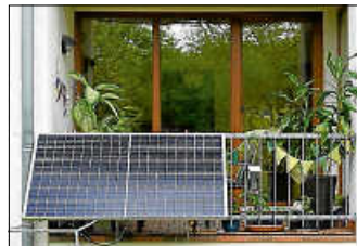
Solaranlage am Balkon speist über Stecker in Wohnungsstromnetz ein