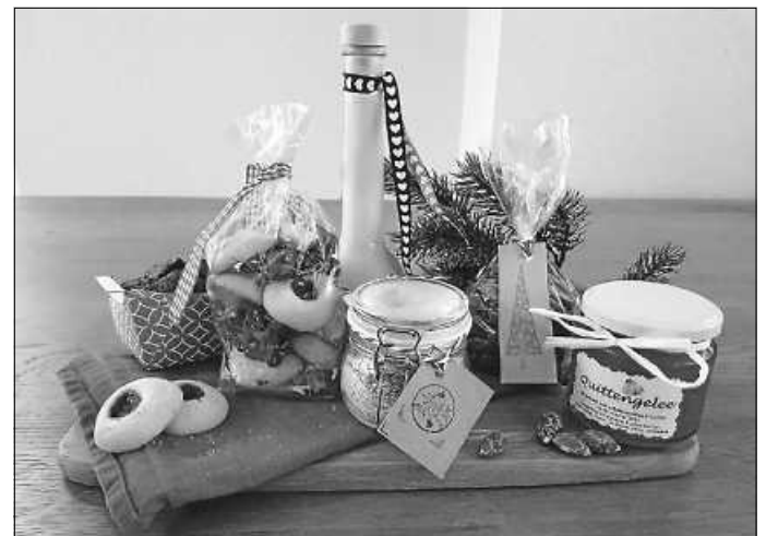
Zum Bestellen: Genusspäckchen