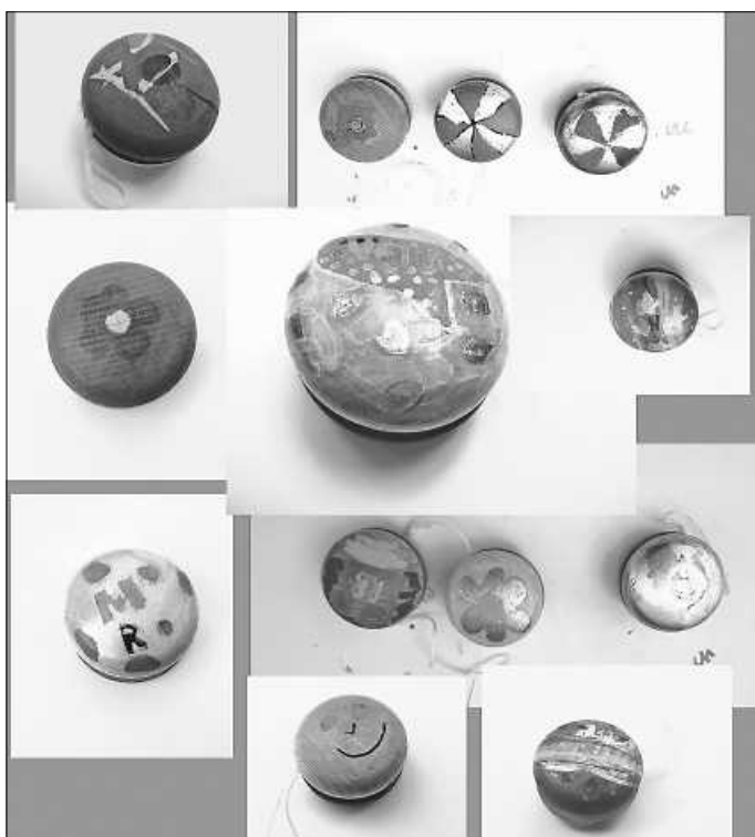
Rund, bunt und lebendig: Jojos vom Marktplatzfest