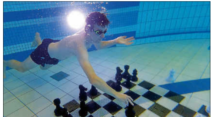
Schach einmal anders