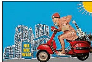
Comedy mit Antje Schumacher

Die Stadt Remseck am Neckar lädt alle interessierten Remsecker Seniorinnen und Senioren zum Seniorenachmittag in die Neue Mitte ein. Auf dem Programm stehen eine Begehung der neuen Stadthalle mit Blick hinter die Kulissen sowie ein exklusiver Besuch in der neuen Mediathek im KUBUS.