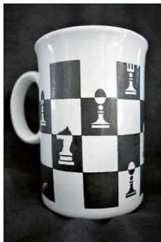
Schachsymbole im Alltag

Wir machen an dieser Stelle ebenfalls Werbung, aber nicht für irgendwelche Produkte, sondern für Schach generell und insbesondere für den Schachtreff der Bürgerstiftung . Dieser findet wieder am Montag, 18. Oktober, um 19 Uhr im Haus der Bürger in Aldingen statt.