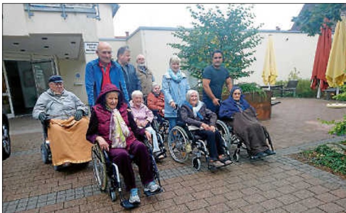
Ein Spaziergang hebt die Stimmung und macht gute Laune

Kleeblatt Förderverein und Kleeblatt - Sozialdienst