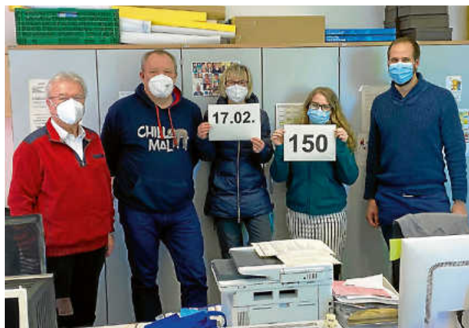
Auf dem Foto ist die sehr zurückhaltende Prognose für Mittwoch, den 17. Februar 2021 auf 150 Personen dargestellt.

Wir möchten an dieser Stelle betonen, dass die Impfung auf freiwilliger Basis stattfindet und die Stadtverwaltung niemanden zu dieser Impfung zwingt.