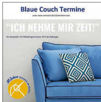
Plakat: Stadt Remseck am Neckar

ich freue mich darauf, das Jubiläumsjahr gemeinsam mit Ihnen zu erleben. Bei zahlreichen Events und Veranstaltungen besteht die Möglichkeit, dass wir uns begegnen. Ich möchte mir im Jubiläumsjahr allerdings ganz bewusst Zeit für Sie nehmen. Nutzen Sie die Gelegenheit, um in entspannter Atmosphäre mit mir ins Gespräch zu kommen. Sie können mir Fragen stellen, ich höre aber auch gerne zu. Erzählen Sie mir von sich und Ihrem Leben in Remseck am Neckar.