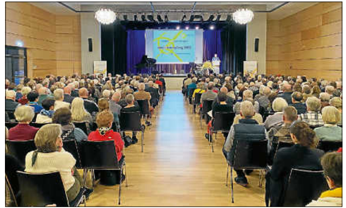
Volle Stadthalle beim Neujahrsempfang 2025

Ein herzliches Dankeschön gilt allen Beteiligten für die gelungene musikalische Umrahmung des Neujahrsempfangs.