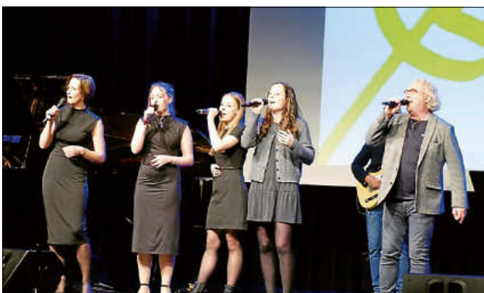
Live-Performance des Remseck Songs