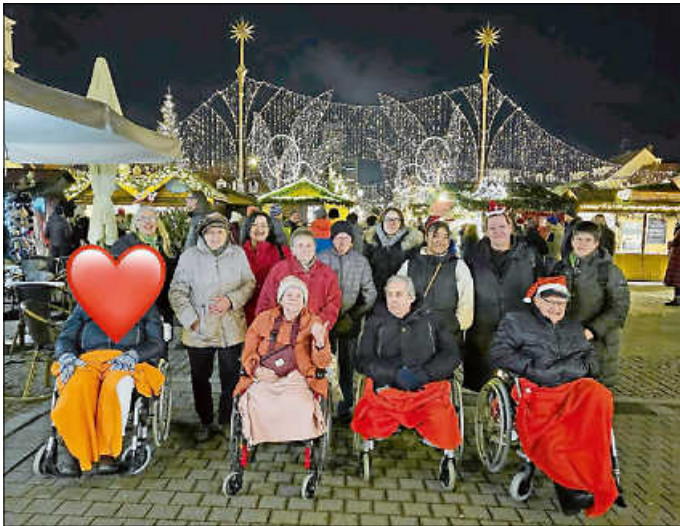
Gruppenbild Bewohner und Mitarbeiter