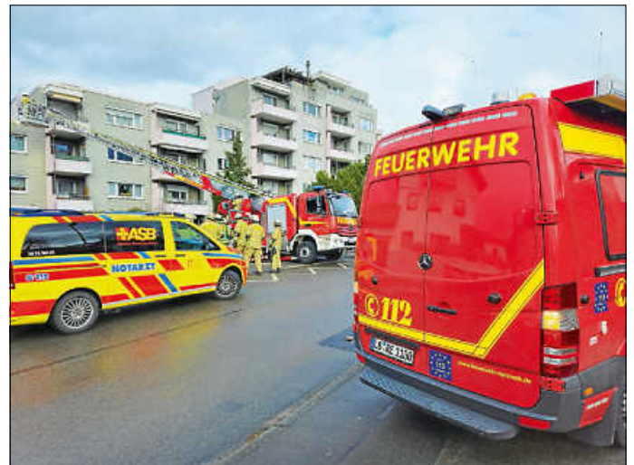
07.01.2025 - Rettung mit Drehleiter aus Gebäude

Zum zweiten Einsatz am Feiertag wurde die Feuerwehr Remseck um 14:00 Uhr in den Stadtteil Neckarrems alarmiert. In enger Zusammenarbeit mit der Polizei, dem Rettungsdienst und dem Notarzt konnte die Person nach kurzer Zeit in ihrer Wohnung gesichert werden. Die Feuerwehr war hier in Bereitschaft, um die Polizei in ihrer Planung mit Material und Personal schnellstmöglich zu unterstützen. (eh)