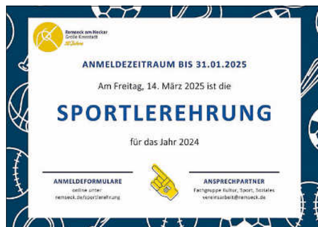
Plakat: Stadtverwaltung Remseck am Neckar

Für Rückfragen stehen wir Ihnen gern unter vereinsarbeit@remseck.de zur Verfügung.