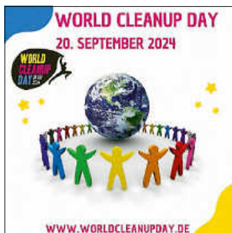
Grafik: World Cleanup Day

Am 20. September ist World Cleanup Day . Weltweit wird an diesem Tag aufgeräumt, recycelt und Müll beseitigt. Indem wir gebrauchten Produkten ein zweites Leben schenken, reduzieren wir weiteren Müll – für eine lebenswerte Welt von morgen, in der wir weiterhin unseren Lieblingsaktivitäten nachgehen können.