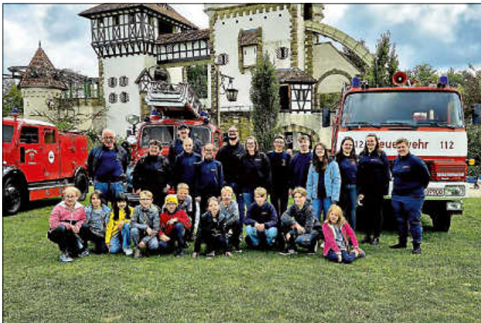
Gemeinsames Gruppenbild aller Musiker

Nach Parkschluss machten wir uns müde auf den Heimweg, waren uns aber alle einig, dass wir diesen Auftritt gerne wiederholen würden.