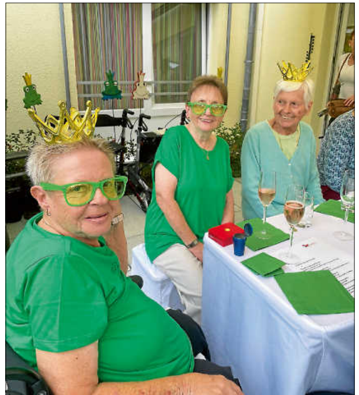
Bewohnerinnen und Angehörige

Anlässlich unserer selbst bemalten Holzfrösche haben wir unser Herbstfest am 08. September dem Froschkönig gewidmet. Bei schönem Wetter haben sich viele Gäste in grüner Kleidung, mit Kronen, Brillen und sogar Froschmützen zum Feiern im Garten getroffen. Wir hatten wirklich Glück mit dem Wetter, denn erst als das Fest zu Ende war, kam der große Regen!