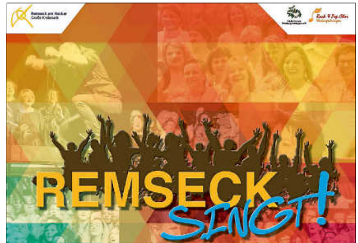
Plakat: Liederkranz Neckargröningen

www.liederkranz-neckargroeningen.de/remsecksingt