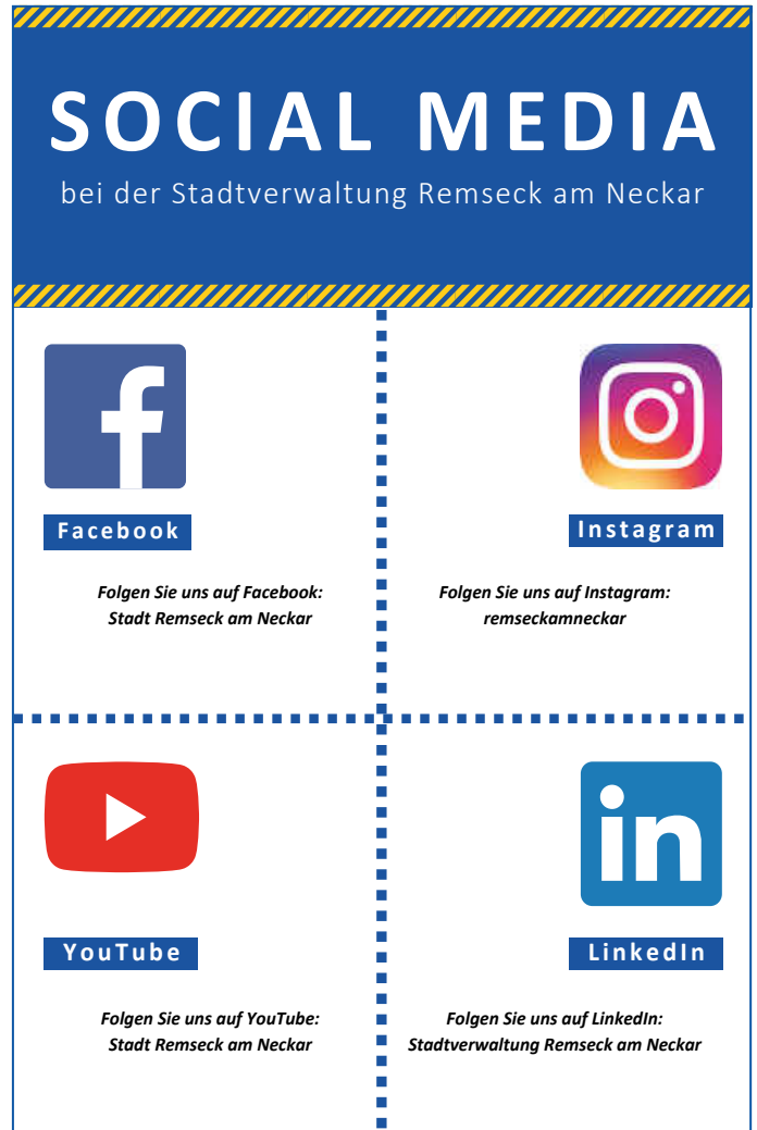
Plakat: Dörte Luedecke