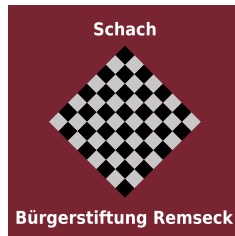
Logo: Gerald Winkler

Beim Schachabend der Bürgerstiftung gibt es keine Meinungsverschiedenheiten. Hier wird Schach nicht wettkampfmäßig betrieben, sondern allein als Freizeitbeschäftigung. Wobei der Ehrgeiz zum Gewinn einer Partei durchaus vorhanden ist. Die nächste Möglichkeit, die Schachgruppe kennen zu lernen, ist am Montag, 7. Oktober . Ab 19 Uhr wird im Haus der Bürger in Aldingen gespielt. Wer sich für das Schachspiel interessiert, ist gerne willkommen.