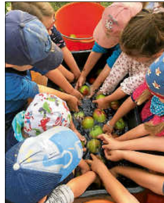
Viele fleißige Hände beim Äpfel waschen.

konnten zuschauen, wie der fertige Apfelsaft aus den eigenen Äpfeln herausgeflossen kam.