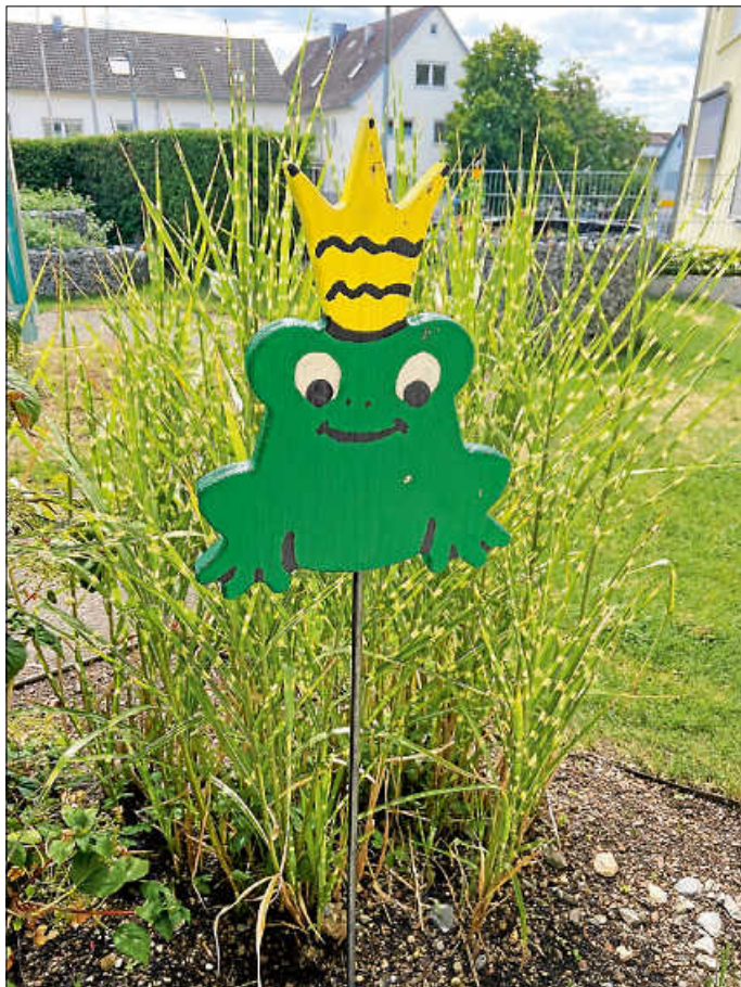
Froschkönig im Garten

Passend zu unseren Holzfröschen, werden wir unser Herbstfest am 08. September dem Froschkönig und der Farbe Grün widmen. Wir freuen uns auf viele grüne Outfits!