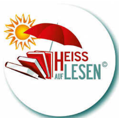
Logo: HEISS AUF LESEN

Auch Bücher aus der HEISS AUF LESEN-Aktion für Erwachsene – Blind Date mit einem Buch – können am Samstag, 07.09.2024, letztmals entliehen werden. Die Loszettel nehmen wir noch bis Samstag, 14.09.2024, entgegen.