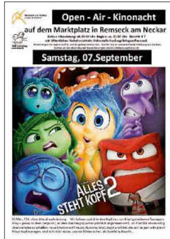
Plakat: Mobiles Kino Ludwigsburg

Der Veranstalter behält sich vor, die Veranstaltung bei sehr schlechtem Wetter abzusagen.