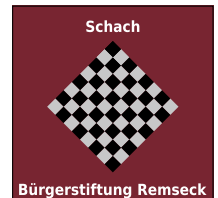
Logo: Gerald Winkler

Der nächste Schachabend im Haus der Bürger findet am Montag, 19. August um 19 Uhr statt.