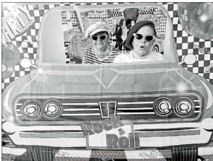
Bewohnerin und Angehörige vor einer Foto-Leinwand

Ein ganz besonderes Sommerfest wurde am 28. Juli im Haus Kastanienblüte gefeiert. Bewohner, Angehörige und Mitarbeiter haben sich auf eine Zeitreise begeben, und sich sogar im 50er- Jahre-Look gekleidet! Mit Schlagern aus den 50er-Jahren hat DJ Maurice aus Remseck für Stimmung gesorgt. Dieses Fest werden wir alle nicht vergessen!