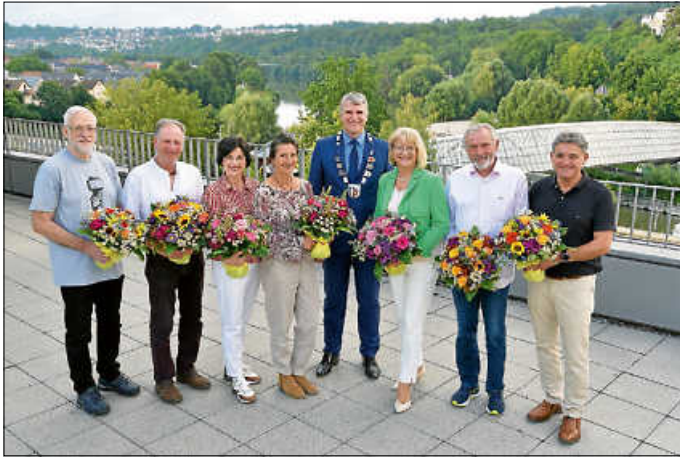
Die ausgeschiedenen Stadträtinnen und Stadträte.