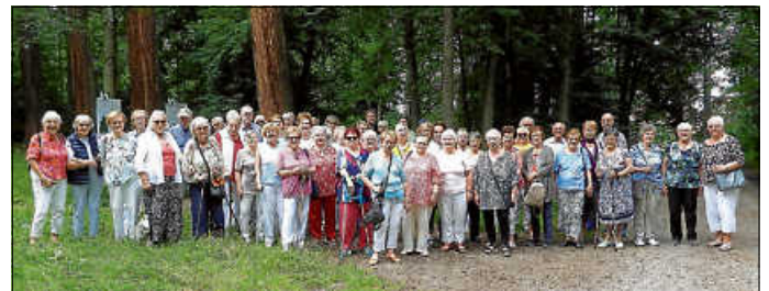
Bei den Mammutbäumen in Welzheim

Nach 7 Wochen Wartezeit gab es am 26. Juli 2024 wieder einen Altenclub-Ausflug. 58 erwartungsfrohe Altenclubler und Freunde erlebten einen angenehmen Sonntag mit leichter Bewölkung. Pünktlich fuhr der Bus an den Ebnisee, der „Perle des Schwäbischen Waldes“. Er wurde im 18. Jahrhundert für die Holzflößerei im Welzheimer Wald angelegt. Bei einem Zwischenstopp in Welzheim bewunderten wir die Mammutbäume. Dort ist einer der größten Standorte dieser ab 1870 in Baden-Württemberg gepflanzten Baumriesen. Am Ebnisee fanden wir Platz auf der Terrasse des Hotels Reich mit Blick auf den See. Hier gab es guten Kaffee und Kuchen. Viele Gäste unternahmen einen Spaziergang an oder um den See herum. Weiter ging die Fahrt Richtung Mainhardt durch die herrliche Landschaft des Schwäbischen Waldes. Im Landgasthof Sonne in Mainhardt-Bubenorbis waren Plätze in gemütlichen Gasträumen für uns reserviert. Die Getränke und die im Bus vorbestellten Speisen wurden zügig serviert. Auch die anwesenden Geburtstagskinder bekamen ihre Glückwünsche und musikalischen Wünsche durch den Altenclub-Chor. Wieder ging ein sehr gut organisierter Ausflug zu Ende, für den sich alle Teilnehmer sehr herzlich bedanken. Bis zum nächsten Ausflug müssen wir uns 4 Wochen gedulden. S. Beyer