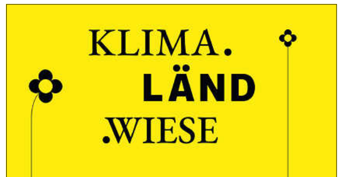
Grafik: Ministerium für Umwelt, Klima und Energiewirtschaft BW