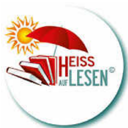
Logo: HEISS AUF LESEN

Lust auf ein literarisches Blind Date? Auch dieses Jahr gibt es in der Mediathek im KUBUS für Erwachsene wieder die Sommeraktion HEISS AUF LESEN – Blind Date mit einem Buch .