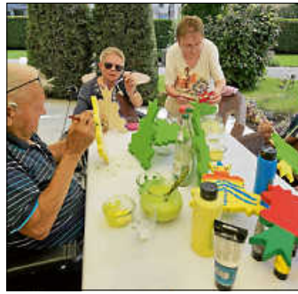
Kreative BewohnerInnen und Angehörige

Derzeit werden die Holzfrösche von BewohnerInnen und Angehörigen bemalt. Es ist uns eine Freude zu sehen, was für einzigartig bunte kleine Werke bisher entstanden sind! Bis alle Frösche bemalt und mit Klarlack behandelt worden sind, dürften nur noch wenige Tage vergehen.