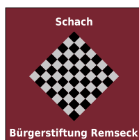
Logo: Gerald Winkler

Die Schachvereine in Baden-Württemberg konnten letztes Jahr einen deutlichen Mitgliederzuwachs verbuchen. Insgesamt 1100 Personen sind zusätzlich in die Vereine eingetreten, so dass es nun 18222 organisierte Schachspieler/-innen im Ländle gibt. Das ist eine Steigerung um 6,42 Prozent. Das Mitgliederplus aller Sportvereine in Baden-Württemberg liegt bei 3,79 Prozent (Daten des WLSB „Sport in BW“, Ausgabe 7/2024). In 393 Schachvereinen sind die Mitglieder aktiv; Jugendliche und