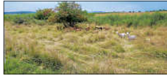
Schafe in der Wildschutzzone

Die Wiesen werden temporär und abschnittsweise mit einem Litzenzaun abgegrenzt. Der Litzenzaun ist in Bodennähe durchgängig, sodass Kleintiere wie Feldhase und Rebhuhn die Fläche weiterhin nutzen und hindurchlaufen können. Vor- sichts, der Zaun ist mit Strom versorgt. Bitte geben Sie Acht, bei der Beobachtung der Schafe nicht dagegen zu kommen. Sollte Ihnen etwas auffallen, wenden Sie sich bitte direkt an Herrn Müller unter 0173 4297577.