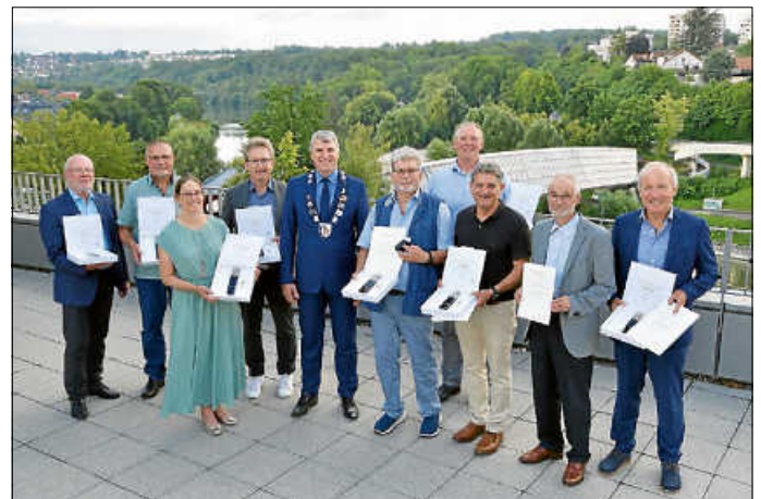
Die geehrten Stadträtinnen und Stadträte.